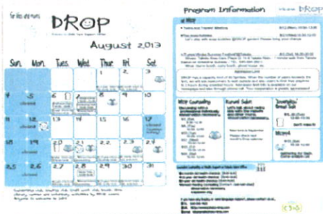
英語版のプログラムカレンダー

英語版のあっとどろっぷカレンダーはご存知ですか？実はこちらは、紙面のデザインから異国交流ランチミーティングのメンバーと一緒に作っています！先月のカレンダーづくりでは、アメリカ人のママ・ロシア人のパパ・日本人のママと多国籍なメンバーで英訳や入力、内容のチェックを行いました。日本で子育てをするのに戸惑っているであろう外国の方、身近な地域の親子の居場所やひろばのことをまだ知らない外国の方にも、少しでも安心して子育てができるよう、子育て仲間と出会ったり情報を得るきっかけになれば、と思っています。「近所に外国人の親子が住んでいる」という方や、「この地域のあの場所で外国人の親子を見かける」という方は、あっとどろっぷ英語版をお渡しください。また、異国交流ランチミーティングメンバーやスタッフまで教えてくださいと幸いです。